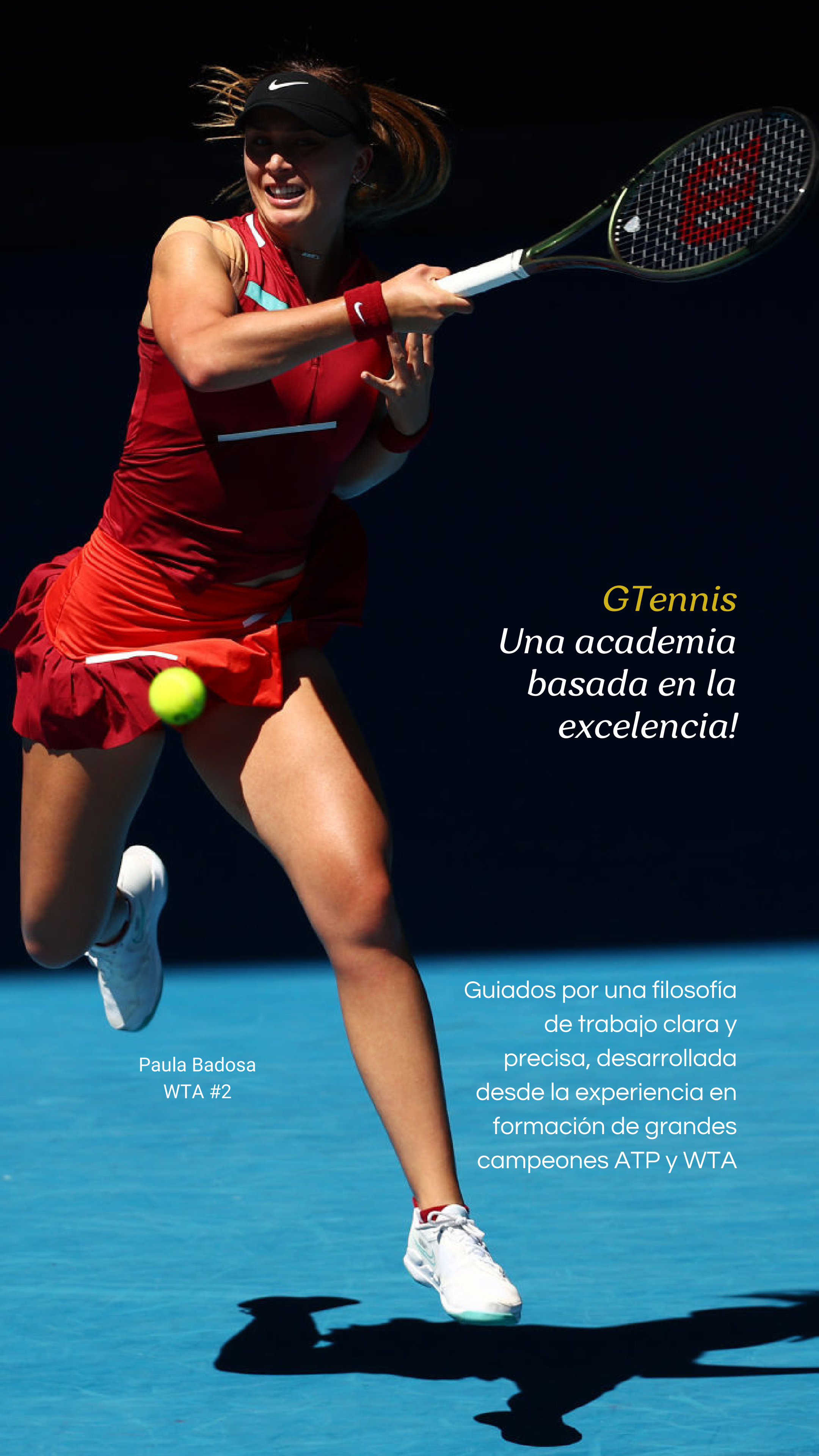
Paula Badosa WTA #2

GTennis Una academia basada en la excelencia!